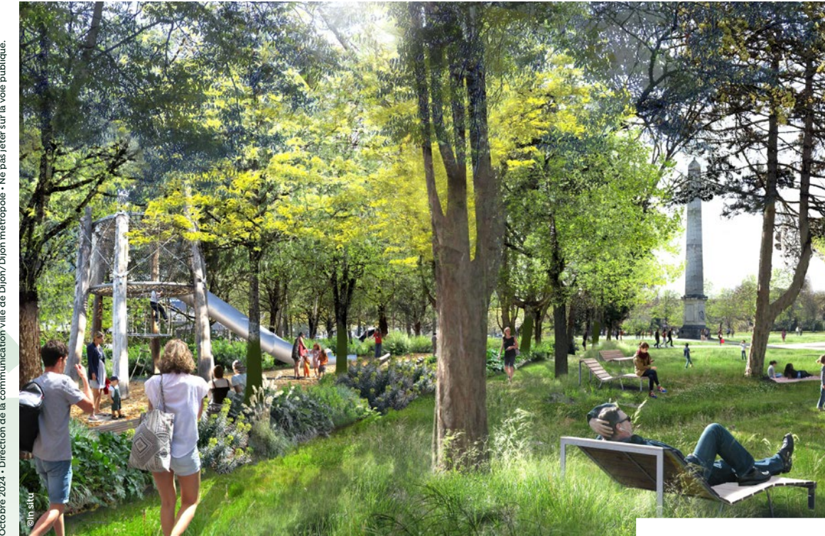
Octobre 2024 • Direction de la communication Ville de Dijon / Dijon métropole • Ne pas jeter sur la voie publique. @in situ