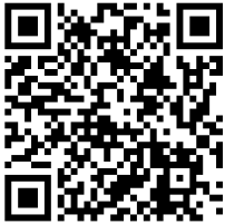
GEM JEUNES "DI'GEM"